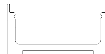
Sezione di ingresso